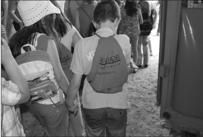
Figura 2 MATERIAL DISTRIBUIDO POR LA EUROCIUDAD EN ACTIVIDADES INFANTILES