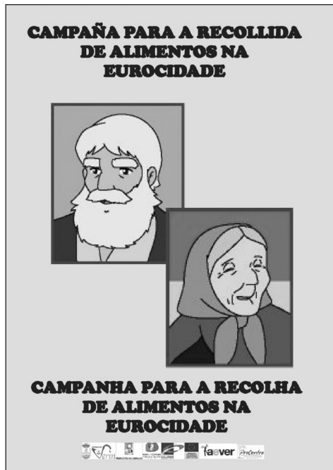
Figura 3 CARTEL QUE ANUNCIA UNA RECOGIDA DE ALIMENTOS PROMOVIDA POR LA EUROCIUDAD, DENTRO DE LAS ACTIVIDADES NAVIDEÑAS