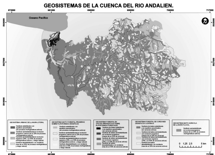
Figura 2 GEOSISTEMAS DE LA CUENCA DEL RÍO ANDALIÉN

Se localiza en la parte media y oriental de la cuenca, corresponde a laderas de cordones graníticos, reforestadas preferentemente con pinos jóvenes de menos de 15 años, que generan coberturas del orden del 70%. Se trata entonces de una geofacie construida recientemente, su edad no supera los 25 años, se manifiestan aquí algunos procesos morfogenéticos de erosión en regueras y cárcavas, controlados por plantaciones de pinos; lo que significa que esta geofacie ha ocupado un territorio precedentemente inestable. La forestación contribuye en el presente a frenar el proceso de avance de las cárcavas, al menos mientras se mantiene la cobertura. El área afectada por este tipo de procesos, representa menos de un 25% de la superficie de la geofacie. Se ha calificado esta unidad como de evolución progresiva, ya que las plantaciones forestales densifican la cobertura vegetal, durante al menos unos diez años, lo que permite pronosticar que si el proceso no es perturbado por incendios; las cárcavas debieran detener su evolución.