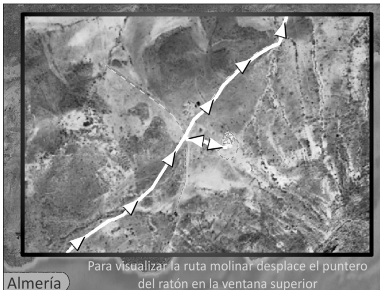
Figura 8 VISOR DE NAVEGACIÓN DE LA RUTA POR ALMERÍA