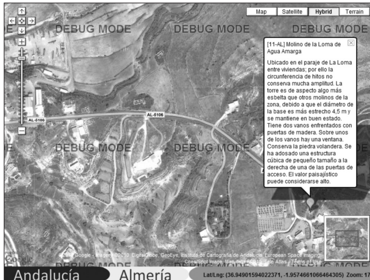
Figura 7 DESCRIPCIÓN GENERAL DE UN MOLINO