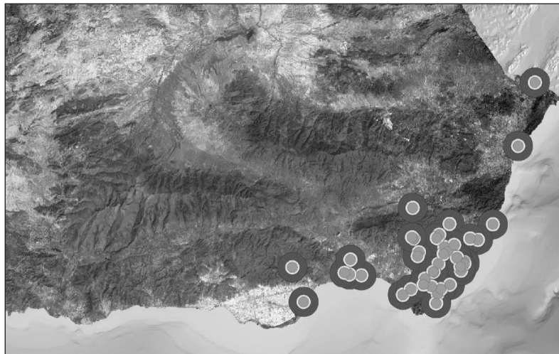
Figura 3 ANÁLISIS POR ÁREAS DE INFLUENCIA DE LOS MOLINOS DE VIENTO DE ALMERÍA