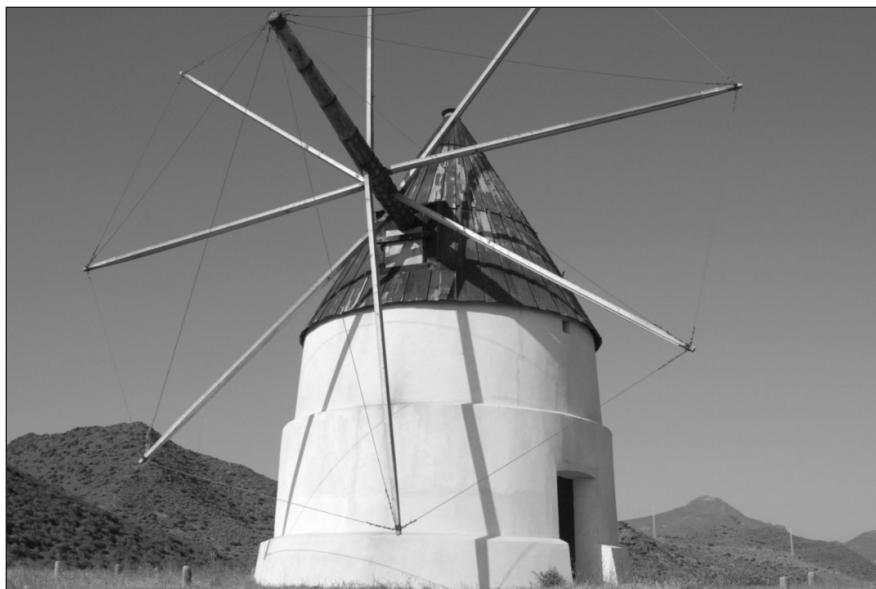
Figura 12 MOLINO DE VIENTO DEL COLLADO DE LOS GENOVESES (ALMERÍA)

En la provincia de Almería, todos estos ingenios se enclavan en pequeños municipios de áreas rurales que no llegan a sumar en total más de 2.500 habitantes. Durante largo tiempo los pobladores de estas zonas trabajaron sus tierras ya que el 80% del espacio fue dedicado a cultivos extensivos del cereal, y otros muchos emigraron y abandonaron el territorio debido a la escasez de oportunidades socioeconómicas. Hoy en día, la mayor parte de la población que habita la zona, vive de la actividad turística o de la nueva agricultura bajo plástico (AA. VV., 2005a), ya que estos municipios pertenecen al Parque Natural Cabo de Gata-Níjar, zona especialmente protegida por sus valores ecológicos, ambientales, paisajísticos y culturales (Mendoza y Navarro, 2006).