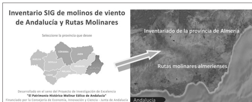
Figura 5 INTERFAZ DEL INVENTARIO SIG

La aplicación Flash se ha realizado gracias al software de Adobe Flash CS4, anteriormente conocido como Macromedia Flash, y desarrollado por Adobe Systems Incorporated, herramienta que trabaja con fotogramas o cuadros donde se integran datos vectoriales, imágenes ráster, sonido, código de programación orientado a objetos como es el caso de ActionScript 3.0 o vídeo, entre otros. En concreto, la información que se puede encontrar en la herramienta Flash es el inventario de los molinos de viento de Andalucía así como las rutas molineras propuestas (Fig. 5).