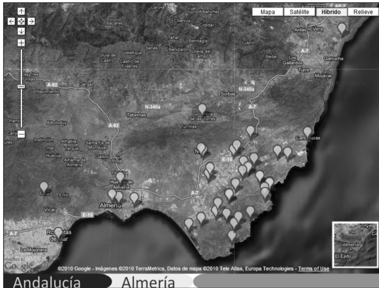
Figura 6 INVENTARIO DE MOLINOS DE ALMERÍA CON LA CARTOGRAFÍA DE GOOGLE MAPS