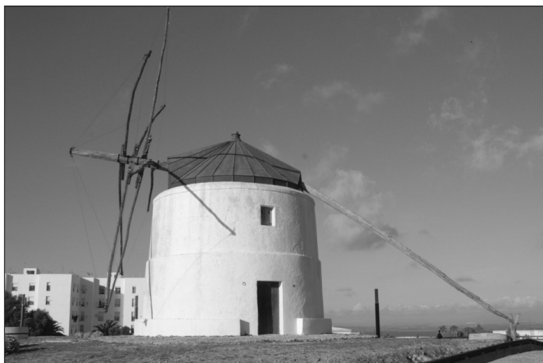
Figura 1 MOLINO DE VIENTO DE SAN FRANCISCO (VEJER DE LA FRONTERA, CÁDIZ)

Por otro lado, un aspecto diferenciador importante se encuentra en los molinos de viento que perduran en los distintos municipios almerienses que incluyen en su mecanismo un regulador centrífugo o sistema de alivio automático (separación de las piedras de moler), elemento innovador en este tipo de construcción e inexistente en los demás ejemplares andaluces que poseen un sistema de alivio manual, lo que permite alcanzar una completa regulación de la molienda y, en consecuencia de la calidad del producto final (harina) (Rojas Sola y Amezcuea Ogáyar, 2005). A continuación se presenta un cuadro sinóptico (Cuadro 1) que presenta la información básica de los molinos citados.