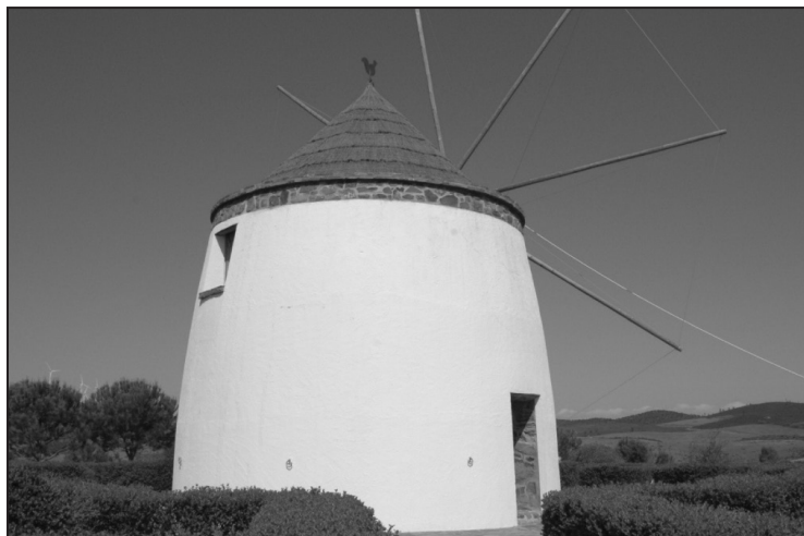
Figura 2 MOLINO DE VIENTO DE LA SOLANA (EL GRANADO, HUELVA)