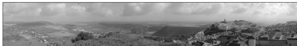
Figura 11 PANORÁMICA DESDE LOS MOLINOS DE VIENTO DE VEJER DE LA FRONTERA (CÁDIZ)

Los resultados obtenidos en estos puntos de observación han sido de ‘Muy Buena’ para el Molino de Santa Inés (Fig. 11) con un total de 76,50 puntos, de ‘Excelente’ para el Molino de Márquez, y de ‘Excelente’ también con un total de 92,50 puntos para el Molino de Buenavista; por otro lado, para los emplazados en la finca de las tres Avemarías la calidad paisajística es de ‘muy buena’ con un total de 68 puntos.