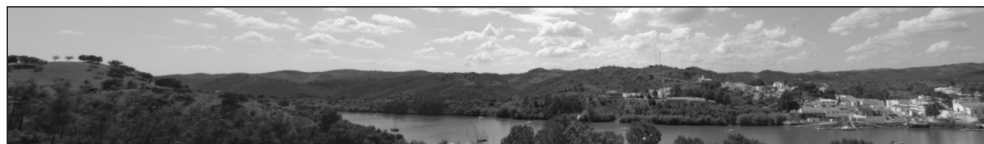
Figura 10 PANORÁMICA DESDE LOS MOLINOS DE VIENTO DE SANLÚCAR DE GUADIANA (HUELVA)