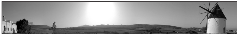
Figura 9 PANORÁMICA DESDE EL MOLINO DE VIENTO DE FERNÁN PÉREZ (ALMERÍA)

se emplaza el Molino de El Collado de los Genoveses que obtiene una calidad de ‘Buena’ con un total de 48,50 puntos.