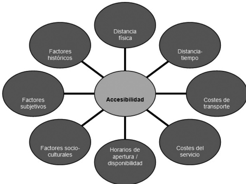
Figura 1 LA NATURALEZA MULTIDIMENSIONAL DE LA ACCESIBILIDAD