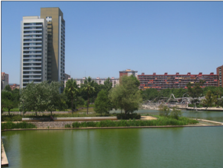
Figura 5 PARQUE DE DIAGONAL MAR