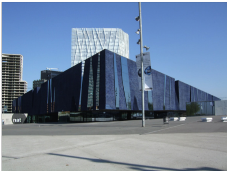
Figura 6 EL FÓRUM