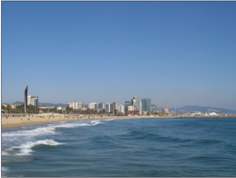
Figura 7 PANORÁMICA DE LA PLAYA FRENTE AL BARRIO