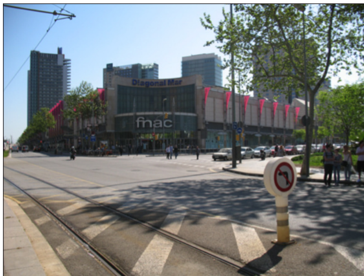
Figura 4 CENTRO COMERCIAL DE DIAGONAL MAR