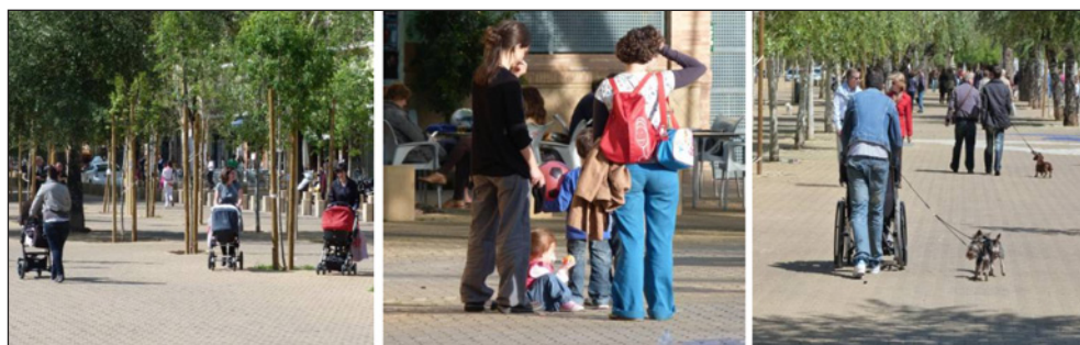
Figura 2 ALAMEDA DE HÉRCULES (SEVILLA). MUJERES Y NIÑOS EN LA MAÑANA DOMINICAL

Por su parte, es preciso tener en cuenta que, como se ha dicho, la atracción como lugar de encuentro de la alameda de Hércules ha ido en incremento, superando en mucho a su entorno más próximo y diversificando perfiles (García, 2011), por lo que a esta relación entre cambios socioeconómicos y género del espacio, cabe añadir referencias culturales propias de un amplio porcentaje de sus usuarios habituales. Así, si en anteriores decenios la alameda de Hércules había sido un icono de emancipación ciudadana (Lees, 2004) o de movimientos contraculturales, la mayor afluencia de personas ha suavizado este rol, aunque siguen siendo observables comportamientos inclusivos, de tolerancia o de equidad en los usos del espacio.