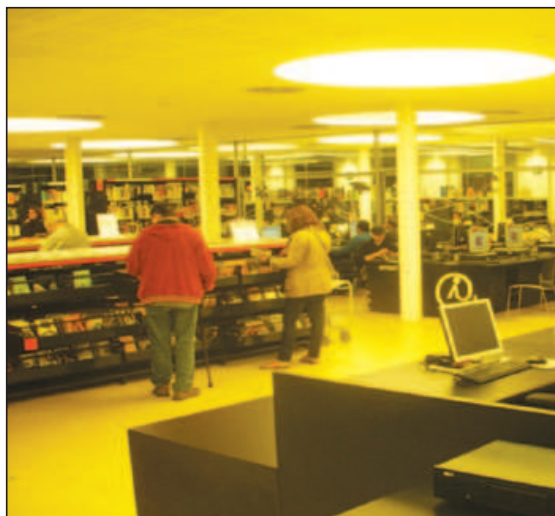
Figura 5 CAN SALADRIGAS, BIBLIOTECA MANUEL ARRANZ