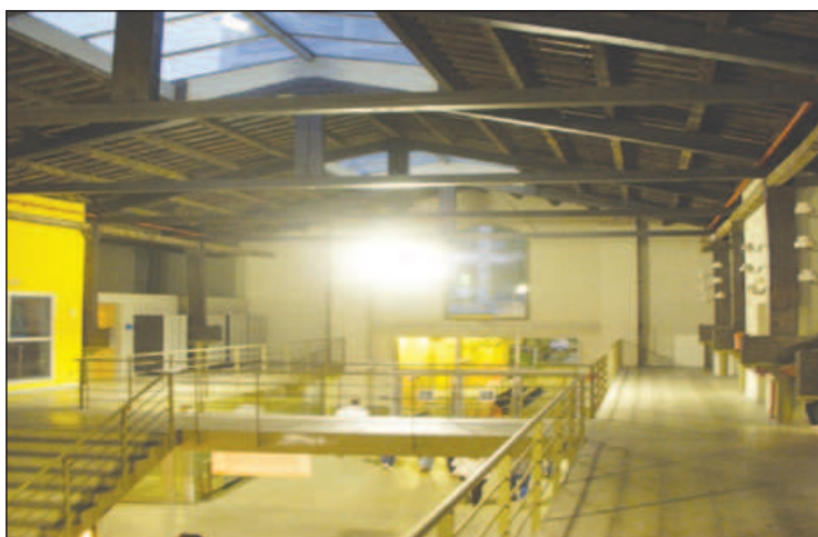
Figura 6 FRANCESC MUNNÉ, ESCUELA SUPERIOR DE DISEÑO BAU