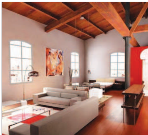
Figura 4 CAN GIL VELL, LOFT