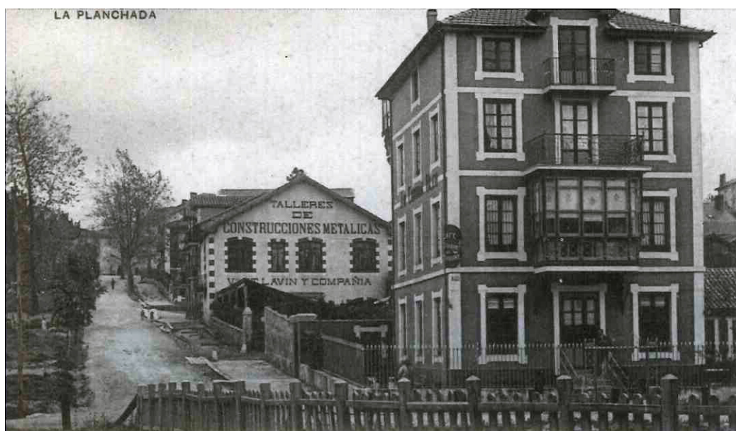
Figura 2. El Cordón Bleu y los Talleres de Bernardo Lavín en La Planchada a finales del siglo XIX