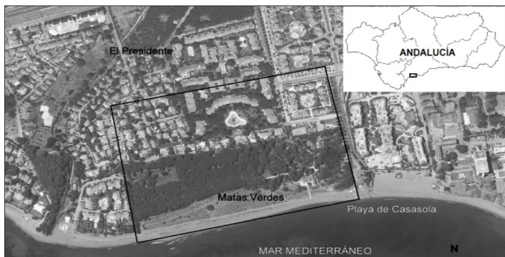
Figura 1 MAPA DE SITUACIÓN

El borde costero objeto de estudio, paisajísticamente diverso, comprende 18 has de litoral del municipio de Estepona, provincia de Málaga (Fig. 1). El extremo más occidental de la playa de Casasola (520 m de longitud) delimita el ámbito al Sur. Se trata de una estrecha lengua de arena, gravas y cantos rodados que no supera los 15 m de anchura media. En el contexto de una costa urbanizada, este tramo de playa aparece respaldado por el arenal de Matas Verdes, un cordón dunar completo que se adentra 200 m hacia el interior y en el que perviven los cinco estadios morfológicos (dunas pioneras, embrionarias, móviles, semifijas y fijas), valles dunares y campo postdunar (Gómez-Zotano, 2009; Gómez-Zotano et al., 2016). Más hacia el interior, se incluye el campo postdunar urbanizado a partir de los años 80 del siglo XX (Urbanización El Presidente).